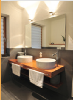
Möbel: Bad, Waschtisch